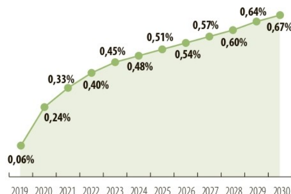
LEY DE CRECIMIENTO