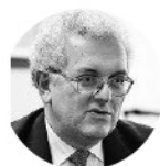
José Antonio Ocampo Excodirector del Banco de la República

“Después de la crisis va a ser esencial enfrentar el aumento de la deuda pública. El Gobierno tiene que pensar en discutir los beneficios que se concedieron a empresas”.