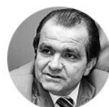
Óscar Iván Zuluaga Exministro de Hacienda

“La crisis va a generar más endeudamiento, cuando se tenga una cuantificación de los esfuerzos del Gobierno habrá que calcular el marco fiscal de mediano plazo”.