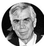
Salomón Kalmanovitz Excodirector del Banco de la República

“El compromiso de una reforma tributaria en el mediano plazo da mensaje de tranquilidad y permite al Gobierno tener acceso a mercados financieros internacionales”.