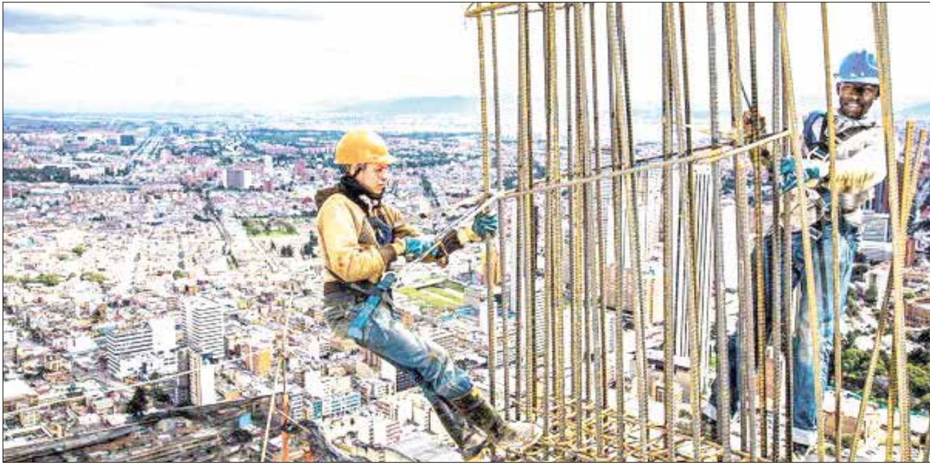
La construcción sigue siendo el lunar de la economía. Por el contrario, el comercio se ratifica como una locomotora, al crecer 5,9 por ciento.

Mientras el país avanza a su mayor ritmo desde el tercer trimestre de 2015, la desocupación se mantiene alta y desaparecen puestos de trabajo. ¿Qué pasa?