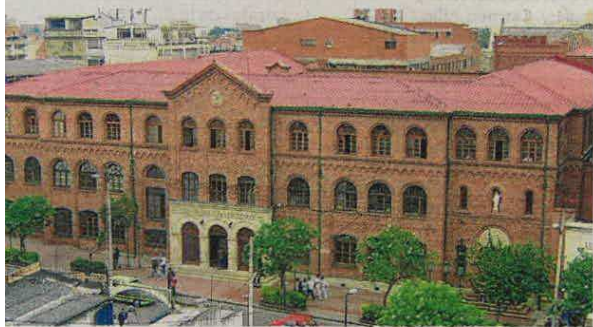
La Universidad Santo Tomás es la más antigua del país, fundada en 1580 por la Orden de Predicadores.

Fuente: World University Rankings QS/Latin America