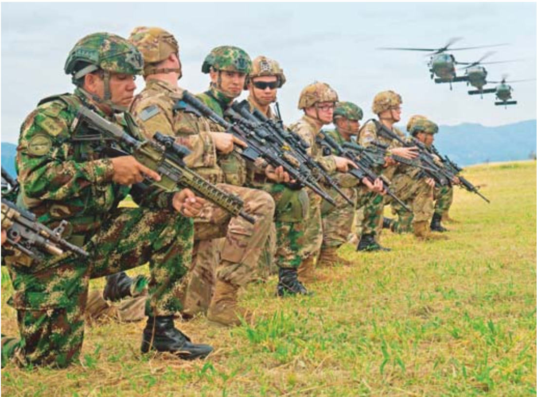
En la foto se identifica uno de los ejercicios militares conjuntos realizados en enero de 2020 entre los soldados colombianos y los militares del Comando Sur de EE. UU. en Tolimaida.

La idea del Gobierno es reactivar el aparato productivo del país con las restricciones necesarias para evitar el contagio, pero es claro que la vida social se mantendrá restringida.