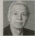
HORACIO AYALA EXDIRECTOR DE LA DIAN

"No pareciera lógico que presentara, además con transcripción, el documento. Pareciera que lo hubieran hecho con otro sistema después de que se les venciera el término y se los estuvieran solicitando".