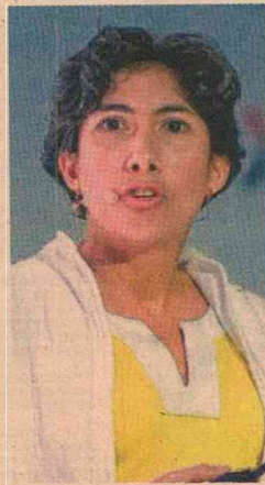
U. de los Andes

Se requiere apoyo a la educación de alta calidad, cobertura y acceso con planes de financiación viables para el futuro profesional, y unido a esto la inserción laboral formal a través de incentivos al sector productivo para la contratación. Por último el modelo del sector salud, mayor cobertura, calidad, pero financieramente viable. Todo lo anterior debe estar acompañado de una política anticorrupción muy clara”.