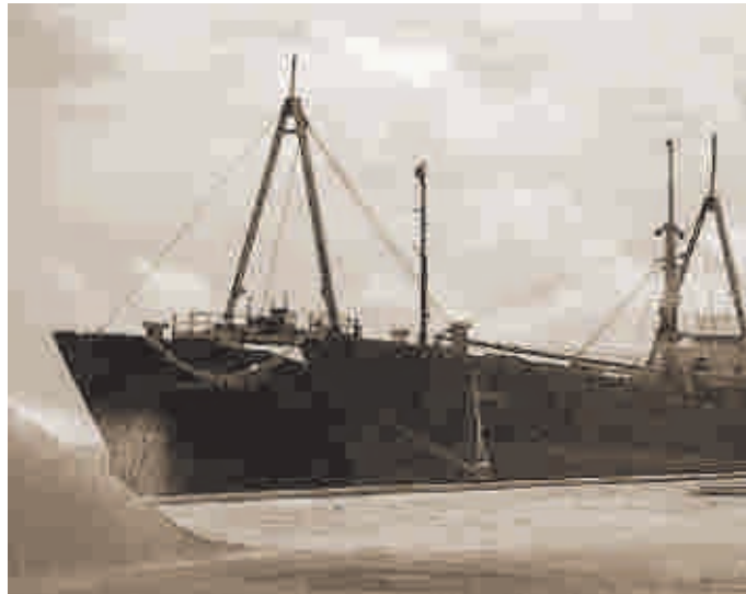
El proyecto de ley de patrimonio sumergido se radicó en el Congreso hace casi dos meses.

El proyecto permite pagarles a exploradores y rescatistas de naufragios hasta con el 50% de lo que encuentren y no sea patrimonio arqueológico.