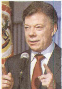
Juan Manuel Santos