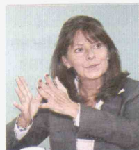
Marta Lucía Ramírez