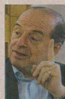
Álvaro Leyva Durán, dirigente conservador que se ha desempeñado como mediador en procesos de paz.

Leyva, de 70 años, fue ministro de Minas y Energía de Colombia entre 1984 y 1985 durante el gobierno de Belisario Betancur. También fue concejal de Bogotá, diputado de Cundinamarca; en 1978 fue elegido representante a la Cámara y en 1982, senador de la República.