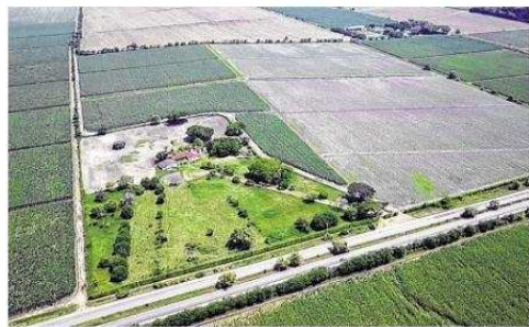
Lifeline Pharma SAS. En jurisdicción de Rozo, corregimiento de Palmira, está ubicada la sede de la empresa.

Entre enero y mayo la Dian tuvo ingresos por $67,87 billones por impuestos. Asimismo, esperan recaudar este año $10 billones adicionales por cobro a morosos.