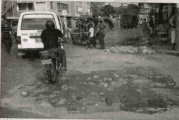
LOS COLECTORES Vía Alternativa etapa I y Ferro V son proyectos que no se están ejecutando actualmente a pesar de la necesidad de estas obras para las comunidades de la zona Norte de Santa Marta.