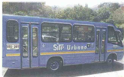
Un bus como estos fue el que causó el accidente y que hoy transitan por las calles bogotanas en el Sistema Integrado de Transporte Público.