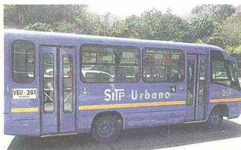
Un bus como estos fue el que causó el accidente y que hoy transitan por las calles bogotanas en el Sistema Integrado de Transporte Público.