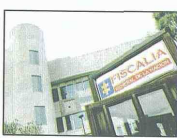
Edificio de la Fiscalía.