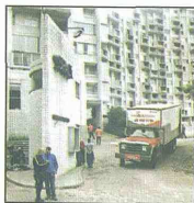
Momentos de la evacuación.

cumplió en las tres etapas del condominio Asensi, el