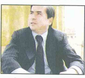
Juan Fernando Cristo

El anuncio lo hizo Vargas Lleras, quien añadió que estas nuevas designaciones fueron avaladas por Santos. "Juan Fernando Cristo va a reemplazar a la doctora María Emma Mejía en la junta de la fundación; nos complace mucho porque el presidente del Congreso