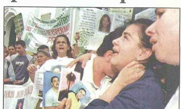
Cientos de víctimas siguen reclamando por una reparación.