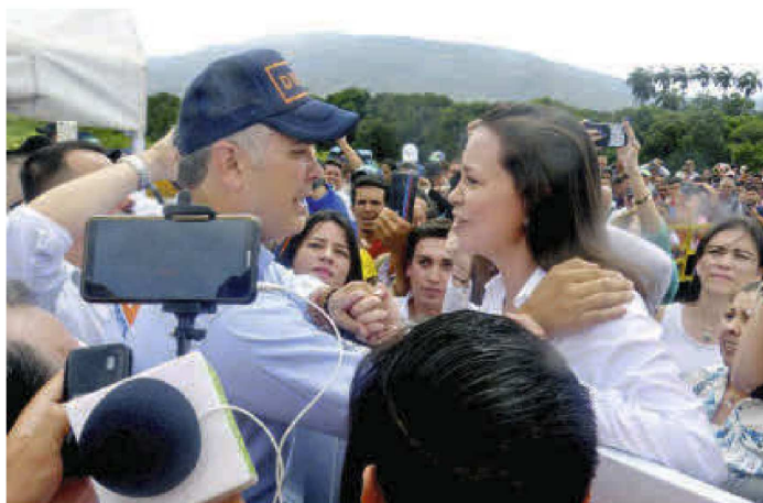
Iván Duque tuvo un encuentro ayer en la frontera con María Corina Machado, opositora de Nicolás Maduro.