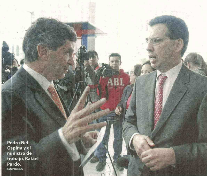
Pedro Nel Ospina y el ministro de trabajo, Rafael Pardo.

" Colpensiones se creó para superar los problemas crónicos del Seguro. La idea era crear una empresa "cero kilómetros". Desde el principio, queríamos ese propósito. Vislumbramos que la creación de Colpensiones no era una tarea fácil, pero el inconformismo con el Seguro Social era enorme", aseguró Oscar Iván Zuluaga , quien asumió como ministro de Hacienda cuando se estaba gestando la nueva entidad.