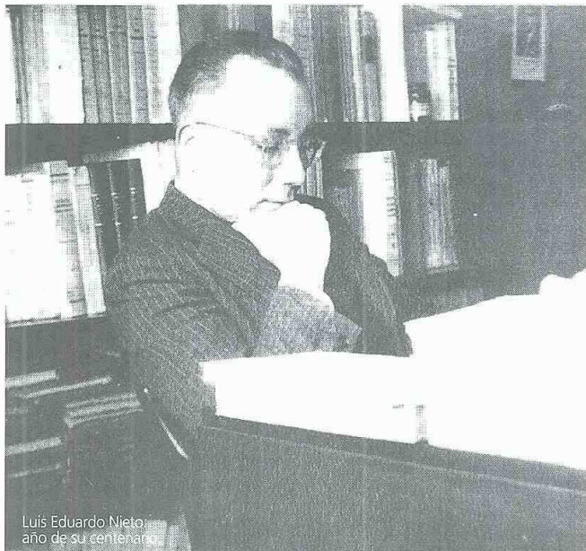
Luis Eduardo Nieto Arteta, año de su centenario

LIBRO SOBRE LA GENERACIÓN QUE BUSCÓ EL PENSAMIENTO MODERNO PARA CAMBIAR EL NACIONAL