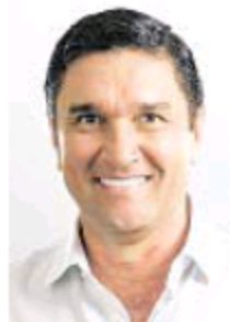
Carlos Cárdenas, alcalde de Bucaramanga.

En cambio, le abona que no ha querido ser el protagonista de todas las acciones: “Eso en política no es bueno, pero en términos de construcción de la legitimidad es positivo”.