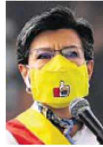
Claudia López, alcaldesa de Bogotá.