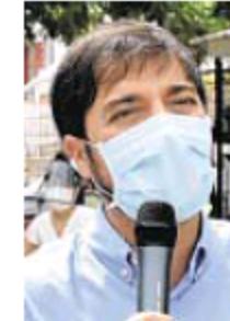
Jaime Pumarejo, alcalde de Barranquilla.

“En la apertura económica lo está haciendo bien, lentamente, revisando todos los protocolos”, asegura.