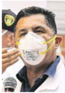
Jorge Iván Ospina, alcalde de Cali.

También le parece acertado que haya recorrido el territorio completo con sus secretarios “para que ellos conozcan de primera mano las necesidades de la comunidad”, al tiempo que otros analistas destacan la buena interacción que ha tenido con la Gobernadora del Valle, lo cual incluso facilitó que la Nación le entregará más ventiladores a la región.