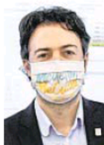
Daniel Quintero, alcalde de Medellín.

El tercer momento es el actual, donde el número de contagios ha aumentado considerablemente. Es cuando se empieza a ver un desgaste. Para el experto, se han evidenciado fallas comunicativas y dificultades en la coordinación con la Gobernación de Antioquia, que en un principio era armónica.