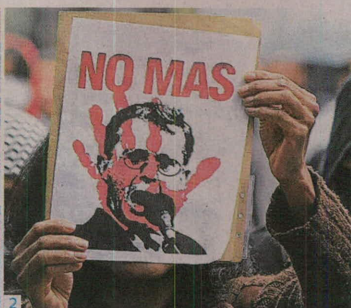
En el pasado, tanto los seguidores de Uribe como sus detractores se han tomado las calles para expresar su punto de vista.