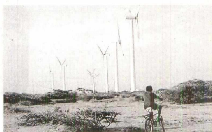
En La Guajira, hay un parque experimental de energía limpia.

Expresó que en esos sitios se hace necesario apelar, entre otras, al uso de fuentes no convencionales de energía renovable para ampliar la cobertura. De hecho el Gobierno tiene como objetivo reducir en un 36% el déficit en la prestación del servicio de energía eléctrica. En 2015 fue expedido un decreto que establece la política pública que permitirá llevarle el servicio de energía a 1 de cada 3 familias que hoy no tienen el servicio, al