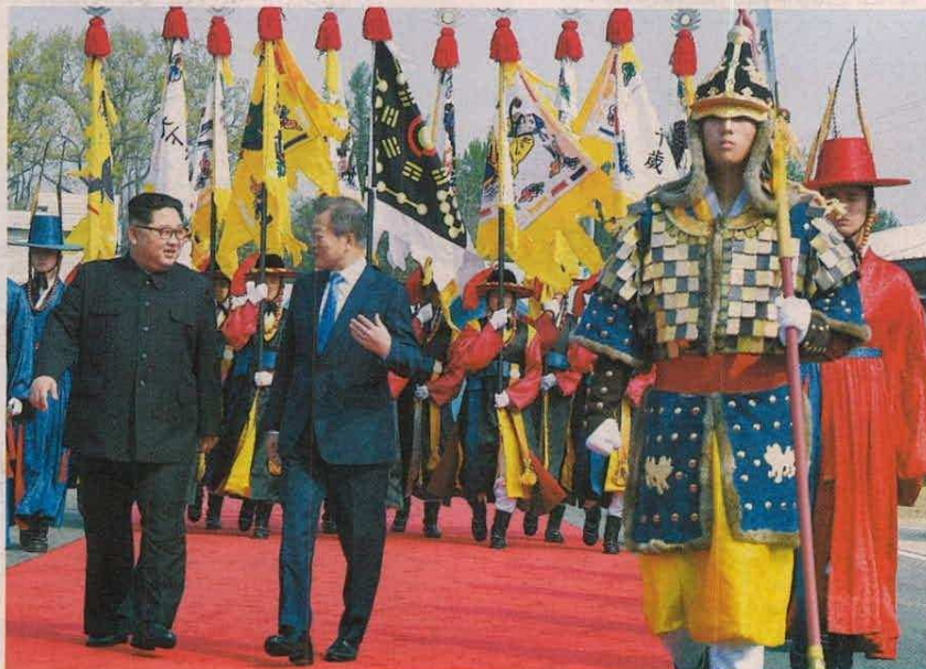
Diálogo entre Kim Jong-un, presidente de Corea del Norte, y Moon Jae-in, presidente de Corea del Sur.

» Kim Jong-un se convirtió en el primer líder norcoreano en cruzar al sur desde hace 65 años, cuando se firmó el armisticio que puso fin al conflicto bélico entre los dos países.