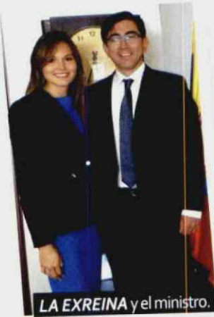
LA EXREINA y el ministro.