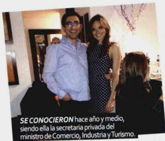
SE CONOCIERON hace año y medio, siendo ella la secretaria privada del ministro de Comercio, Industria y Turismo.