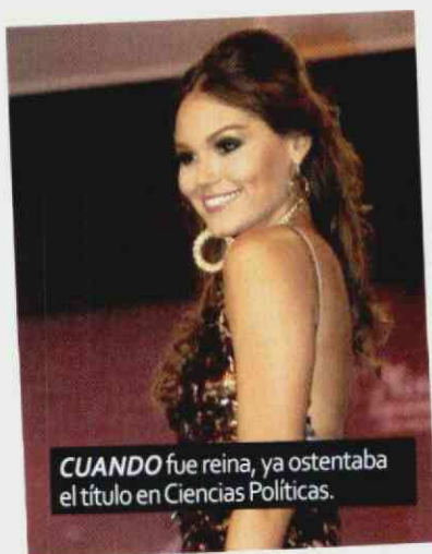
CUANDO fue reina, ya ostentaba el título en Ciencias Políticas.