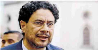
Iván Cepeda, senador del Pacto Histórico.

partido se ha comprometido con forjar el Gran Acuerdo Nacional “en torno a los problemas y, sobre todo, a las soluciones de esos problemas estructurales más críticos que tiene hoy la sociedad colombiana: el problema de la democracia, de la miseria y la inequidad social, el problema de la violencia o la paz total, el medio ambiente y la crisis climá-