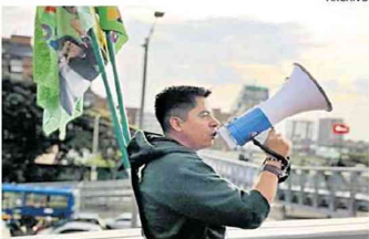
El senador Ariel Ávila, Verde Centro Esperanza.

cuatro años. Y otra cosa es el frente amplio, que es básicamente la unión del bloque alternativo de cara a las elecciones de 2023 y que ojalá nos lleven hasta las elecciones de 2026”. En ese escenario, agregó el parlamentario, quien llega por primera vez al Capitolio, la Alianza Verde está en la coalición de gobierno y en el frente amplio: “El uribismo, o un sector del uribismo, solo estaría en el Acuerdo Nacional, o el caso de La U, que ahora se declararía de gobierno, que está en la coalición de gobierno, y están en el Acuerdo Nacional, pero no están en el frente amplio; entonces, eso te permite distinguir quién está más comprometido y eso significa que la Alianza Verde tiene unos mayores niveles de articulación con el Pacto Histórico”. A su vez, el senador Iván Cepeda, del Pacto Histórico, manifestó en diálogo con este periódico que el