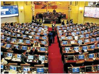
El Congreso de la República se instala el 20 de julio.

podría ser independiente en el Senado, al igual que la ex candidata vicepresidencial Marelen Castillo en la Cámara, aunque en el documento formal de aceptación de la curul ante el Consejo Nacional Electoral, CNE, mencionaron la posibilidad de hacer oposición. Así las cosas, la única bancada que se quedaría en la oposición sería la del Partido Centro Democrático, con 13 legisladores en la cámara alta y 16 en la cámara baja. En la Cámara tendrían un aliado con la llegada del activista Miguel Polo Polo. En todo esto, por otro lado, habría que tener en cuenta que aún no ha declarado oficialmente por parte del CNE la totalidad de la elección del Congreso, lo que no es nuevo, pues en la legislatura anterior la