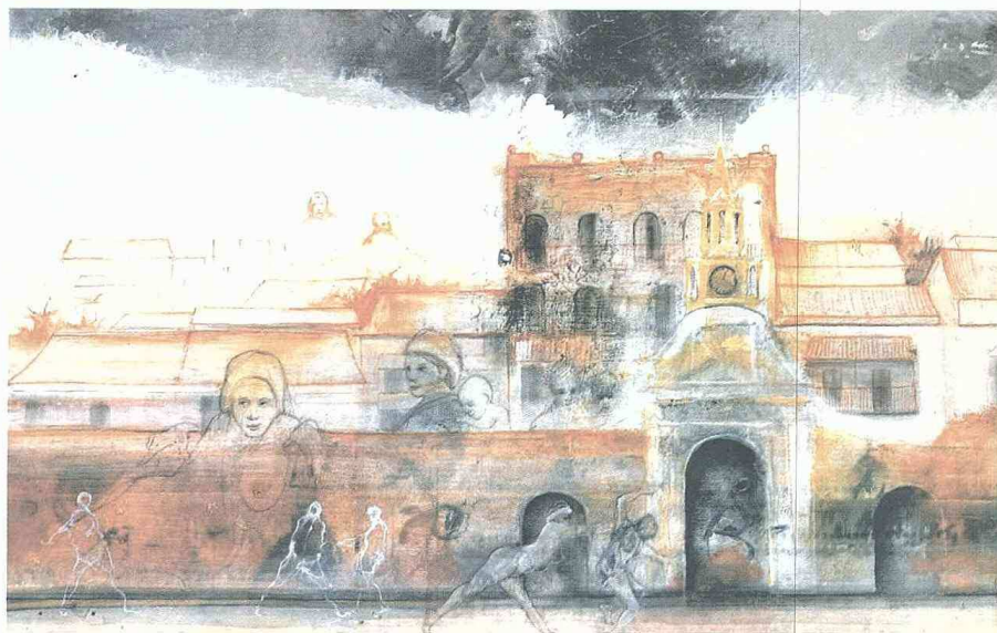
“Puerta del reloj y sus presencias”.

presentación abstracta y en ellos los cuerpos son pequeños, como múltiples sombras o múltiples figuras negras, a contraluz, que se desplazan en un fondo donde las formas no son claras y el artista ha procurado experimentar con el color.