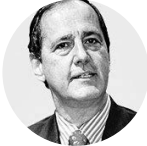
Juan Camilo Restrepo Exministro de Hacienda

En contraposición, el director de Econometría y expresiden-