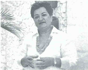
Lograr la paz no es solo firmar un acuerdo, afirma Sáenz.

a ese circo es muy alto, al cual no prefiero pertenecer. Ante el panorama prefiero la academia, seguir estudiando y en el futuro compartir mis conocimientos con la muchachera en alguna universidad de la Región.