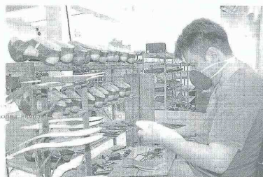
Se gravarán los salarios de los trabajadores que devenguen más de $3,8 millones.

«La gran apuesta del Gobierno Nacional de eliminar los paraísos fiscales