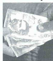
Entre 3 y 5% de incremento son las apuestas para el salario mínimo en 2013, cuya discusión empezó ayer.