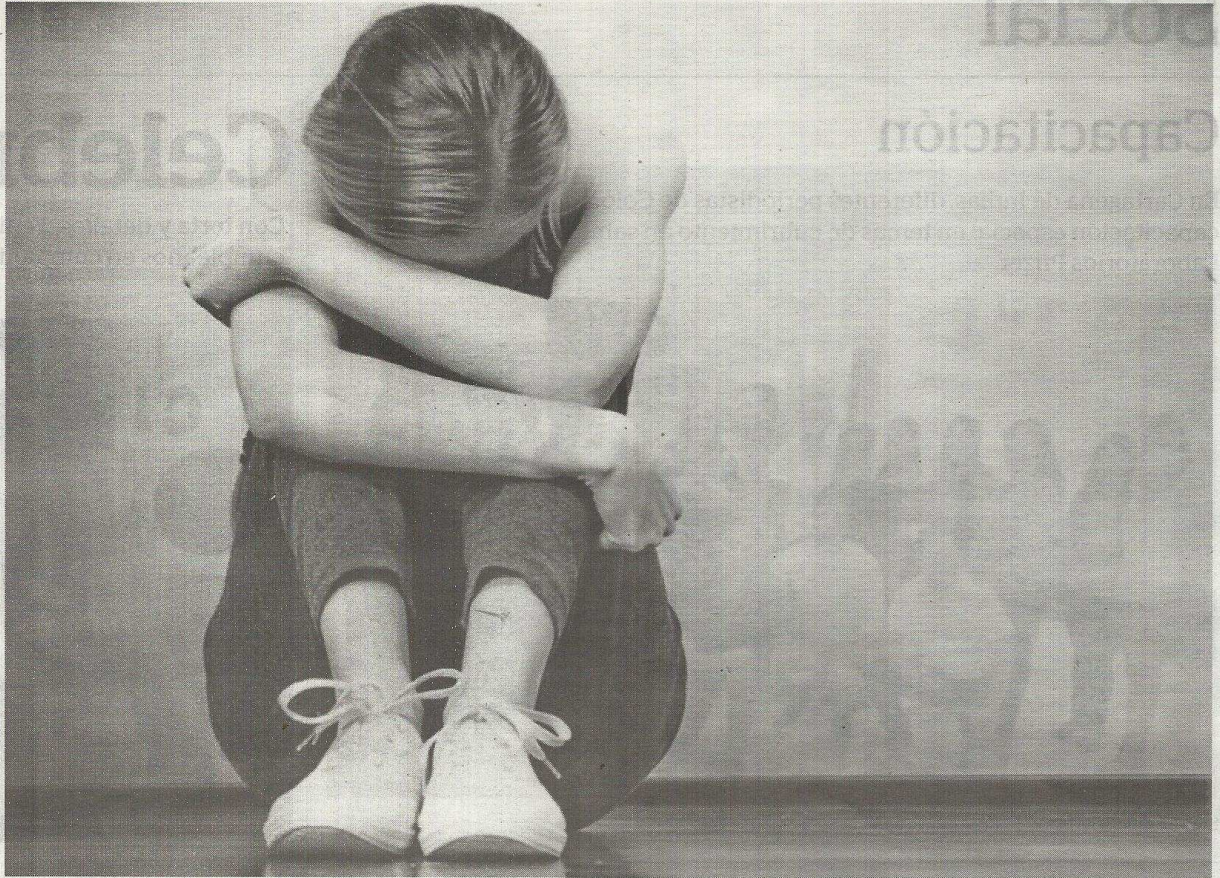
El 79 % de todos los suicidios se produce en países de ingresos bajos y medianos. En Colombia, tiene unas tasas progresivas del 10%.

"Los cuatro magistrados que se pronunciaron se lamentan, en primer lugar, de que no hubo mayoría de la parte considerativa. Algunos, incluso, por el contrario, dicen que las cláusulas de las aseguradoras no son abusivas, sino que son loables y humanas, porque buscan