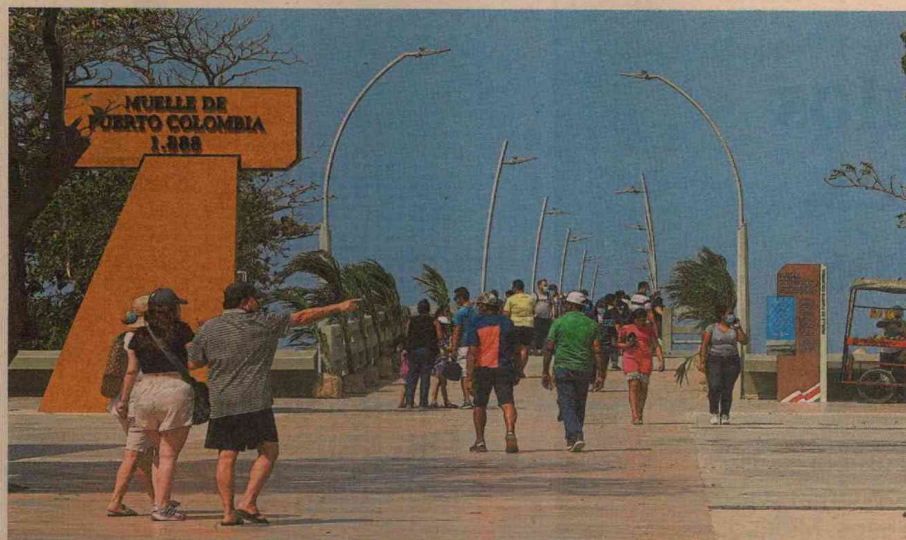
A 2050, para los expertos podría llegar Colombia con un crecimiento del 2% anual a reemplazar el petróleo. CEE

“Y el turismo extranjero, que es una transferencia de riqueza del mundo hacia acá, equivale a una exportación económicamente hablando igual, el turismo extranjero llegando a Colombia puede ser, en el corto