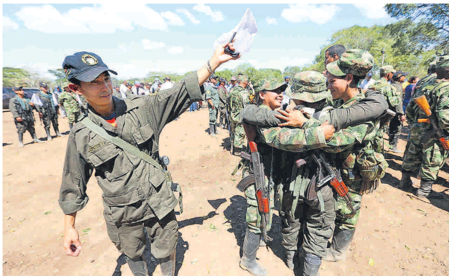
Miembros de las Farc llegan a Fonseca (Guajira) para ubicarse en una de las 26 zonas de desarme, dentro de lo acordado con el Gobierno.

Tomando en cuenta lo explicado, no hay problema alguno frente a la compatibilidad de los estándares internacionales con el acuerdo final especial por tres razones: i) no hay amnistía para crímenes atroces, ii) las víctimas están en el centro del debate y iii) en América Latina es la primera vez que se plantea la existencia de la justicia transicional con un tribunal de paz que realizará la determinación de responsabilidad de los implicados.