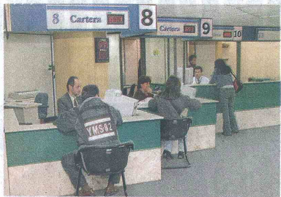
COLOMBIA ES EL CUARTO PAÍS de Suramérica con la tasa de intermediación más alta.

considerados de alto riesgo, es decir, los que actualmente se están bancarizando y por lo tanto, no tienen experiencia en el sector".