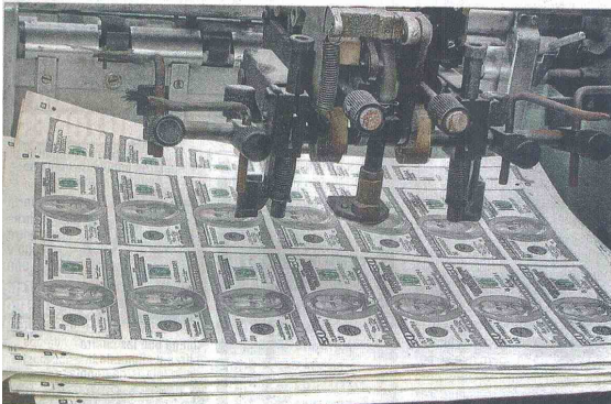
ESTA SEMANA LAS CIFRAS del sector inmobiliario de EE.UU. y la reunión del BCE influirán en el comportamiento del dólar.

Las expectativas para esta semana son muy inferiores a los $1.781 que se esperaba para los últimos días de enero.