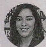
María Fernanda Suárez Ministra de Minas y Energía