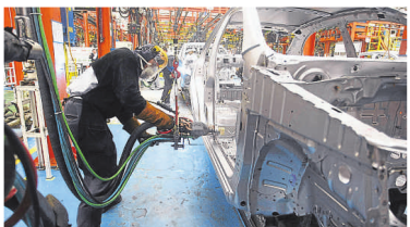
Dado el buen momento del mercado, GM Colmotores prevé un crecimiento de ventas este año del 18 %.

A julio, las matrículas de carros habrían crecido 5,6 %.