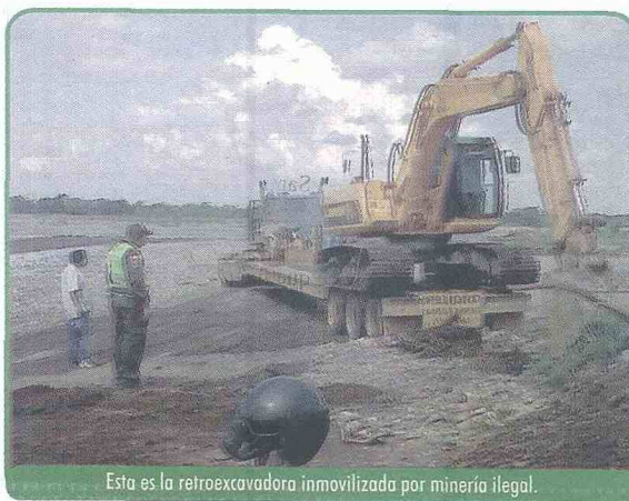
Esta es la retroexcavadora inmovilizada por minería ilegal.

Cormacarena confirmó que se trata de la misma empresa a la que en un primer operativo hace menos de un mes se le inmovilizó tres retroexcavadores y una volqueta.