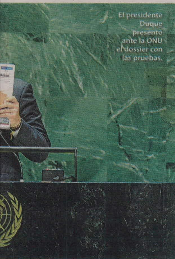
El presidente Duque presentó ante la ONU el dossier con las pruebas.