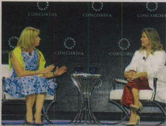
Paula Dobriansky, miembro de la cumbre Concordia y la primera dama.