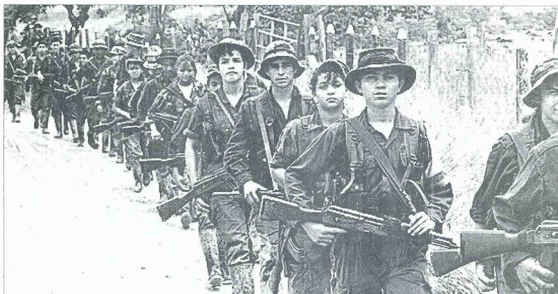
LAS NEGOCIACIONES entre el gobierno colombiano y las Farc llegarán a un punto muerto cuando se aborde el tema de la entrega de las armas del grupo terrorista el cual ha dicho que "esa foto el gobierno no la tendrá".

Solo siete años después de firmado el acuerdo, en septiembre del 2005, el IRA informó que habían concluido la destrucción de todo su armamento y ratificaron su deseo de continuar con la lucha