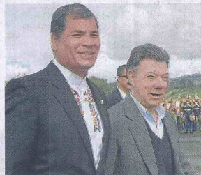
LOS ESFUERZOS del presidente Santos para consolidar la integración con Ecuador podrían verse afectados por el nuevo escándalo. En la gráfica el presidente Rafael Correa.