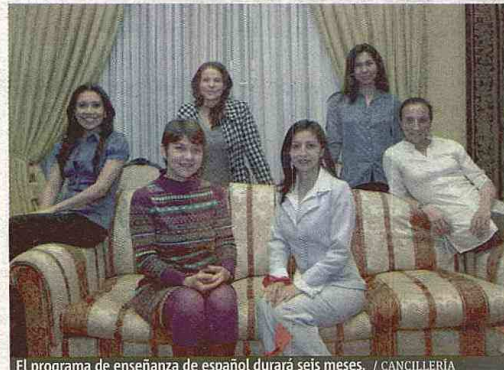
El programa de enseñanza de español durará seis meses.