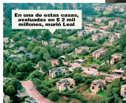
En una de estas casas, avaluadas en $ 2 mil millones, murió Leal

Leal era socio de una peluquería en este centro comercial de Cajicá.