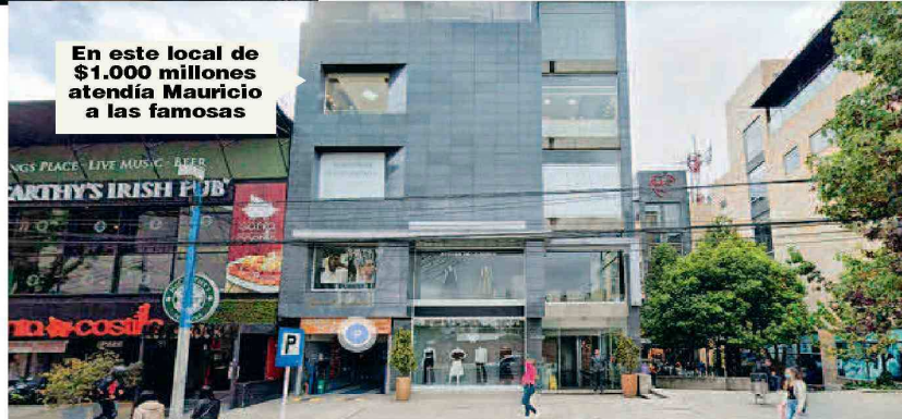
En este local de $1.000 millones atendía Mauricio a las famosas