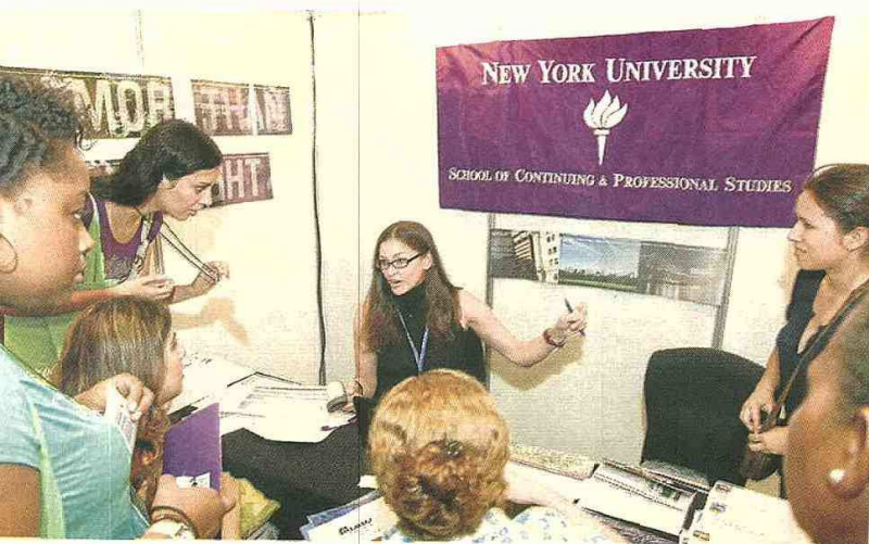
La demanda de estudiantes colombianos que deciden realizar estudios universitarios en el exterior sigue creciendo.