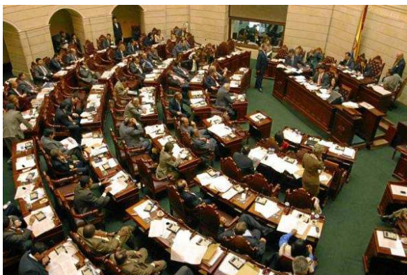
Estudio demuestra que Colombia no está tan mal políticamente