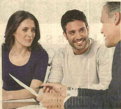
Hoy los créditos educativos les ofrecen a los estudiantes la posibilidad de pagar durante el tiempo que curse el posgrado.

Retomando el ejemplo del posgrado de un año por valor de 10 millones de pesos, la persona pagaría en los primeros 12 meses el 40 por ciento -$4 millones- en cuotas de $372.463,13 y el resto lo podría financiar a 2 años en obligaciones mensuales de $513.644,90. La tasa de interés en esta línea es de 1,55 por ciento.