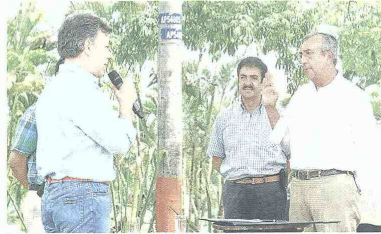
Posesión del nuevo ministro de Agricultura, Francisco Estupiñán Heredia.

Ante el presidente, Juan Manuel Santos, se posesionó ayer Francisco Estupiñán Heredia como nuevo Ministro de Agricultura, quien reemplazó a Juan Camilo Restrepo. El saliente jefe acompañó al nuevo funcionario en el acto que se cumplió en Nocaíma (Cundinamarca). El nuevo miembro nació en Guatemala (Boyacá), se graduó como administrador de empresas en la Externado de Colombia y también tiene una especialización en economía de Los Andes.