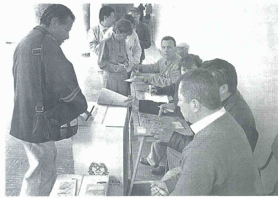
La revocatoria del mandato es uno de los siete mecanismos de participación popular previstos en el artículo 103 de la Carta Magna, al lado del voto, el plebiscito y el referendo.

El Ministerio Público ha advertido asimismo que se constituye en causal de mala conducta, sancionable a la luz del Código Disciplinario, la destinación de recursos