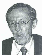
Antonio Navarro Wolff, dirigente.