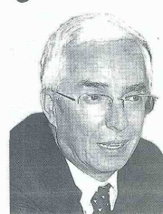
Jorge Robledo, senador.

Según el congresista "el proyecto restringe el uso de internet porque prohíbe 'la retransmisión a través de Internet de señales de televisión', el almacenamiento temporal de la información protegida que se descargue de la red y el uso de esta información para fines no comerciales".