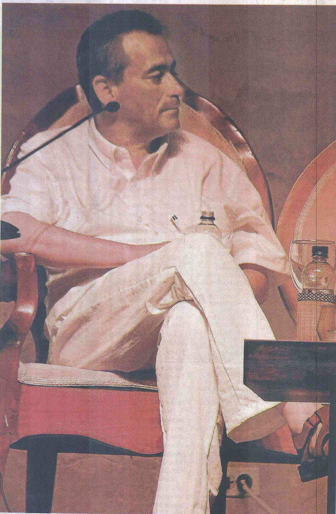
EL NOVELISTA EVELIO ROSERO DIAGO, Premio Nacional de Novela Mincultura 2014.

La más audaz estructura narrativa pues es un desafío a la 'novela histórica', que el autor logra sacar adelante con mucho brío": jurado.