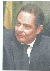
Germán Vargas Lleras, ministro de Vivienda, Ciudad y Territorio.

Como se recordará, el Ministerio de Vivienda entregó a la Fiduciaria de Bogotá el proceso de selección de las firmas constructoras competentes, para la construcción de los proyectos de vivienda en las diversas regiones de Colombia; incluidas las de la capital santandereana.