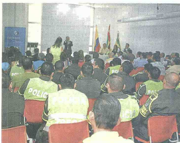
El Seminario 'Régimen Jurídico del Tránsito Terrestre en Colombia' tuvo lugar ayer en el Centro Empresarial Cajasan.