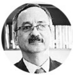
Gustavo Toro Presidente de Cotelco

“El sector turístico está ligado al sector aéreo. Una quiebra de Avianca sería fatal por el peso que tiene en el mercado y si no hay conectividad, es difícil que el sector hotelero repunte”.