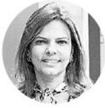
Flavia Santoro Presidente de Procolombia

“El sector turístico está ligado al sector aéreo. Una quiebra de Avianca sería fatal por el peso que tiene en el mercado y si no hay conectividad, es difícil que el sector hotelero repunte”.