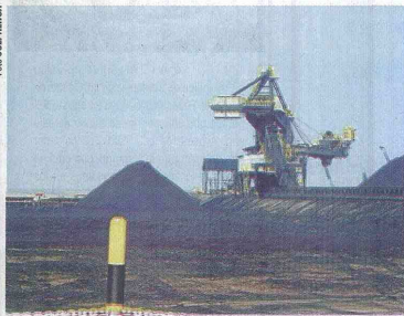
LAS TRES GRANDES CARBONERAS DEL PAÍS solo llegarán a 82 millones de toneladas al año, muy por debajo de la meta establecida por el Gobierno.

Dos tercios de franceses (63%) estiman que su poder adquisitivo ha bajado los doce últimos meses y una mayoría (58%) anticipa un nuevo retroceso el próximo año.