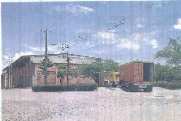
CON LA REESTRUCTURACIÓN DE LA ACTUAL ZONA FRANCA se generarían cerca de 2.000 nuevos empleos.

Según dijo Angarita, la idea es que el Gobierno departamental sea el que pida la titulación gratuita del terreno para después ponerlo a disposición del régimen franco. "Es allí donde se podría estable-