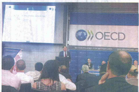
EN LA ÚLTIMA REUNIÓN DE LA OCDE, la organización redujo las perspectivas económicas para Estados Unidos y la Unión Europea.

India, en cambio, tendrá un crecimiento de 5,7% este año (0,8 puntos más que en mayo) y de 5,9% en el 2015, sin cambios respecto a la previsión anterior.