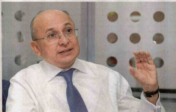
Eduardo Montealegre Lynnet, fiscal general de la Nación.

Son precisamente con Álvaro Uribe y el Centro Democrático sus principales disputas, donde ha tenido que sortear momentos cla-