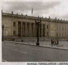
Congreso de la República.

La próxima semana la Cámara de Representantes continuará discutiendo la reforma al Código de Procedimiento Penal. También tendrá un debate de control político sobre las batidas ilegales y las manifestaciones en el país.