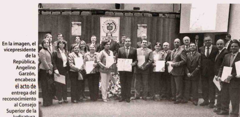
En la imagen, el vicepresidente de la República, Angelino Garzón, encabeza el acto de entrega del reconocimiento al Consejo Superior de la Judicatura.

Por la gestión de sus salas administrativas, la Dirección Ejecutiva de la Administración Judicial y 104 despachos jurisdiccionales, el Consejo Superior de la Judicatura recibió varias certificaciones del Icontec en normas de calidad.